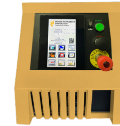
Smart Charge 5