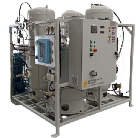
Sistema de recuperación de Helio