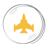
MILITAR Y DEFENSA