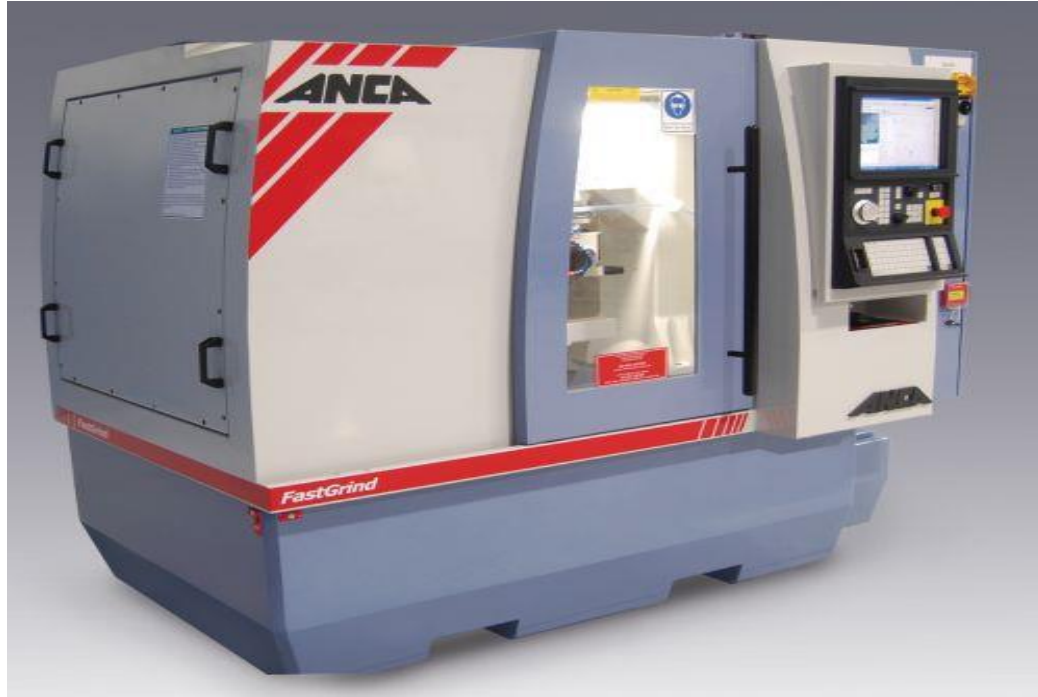
ANCA FAST GRIND