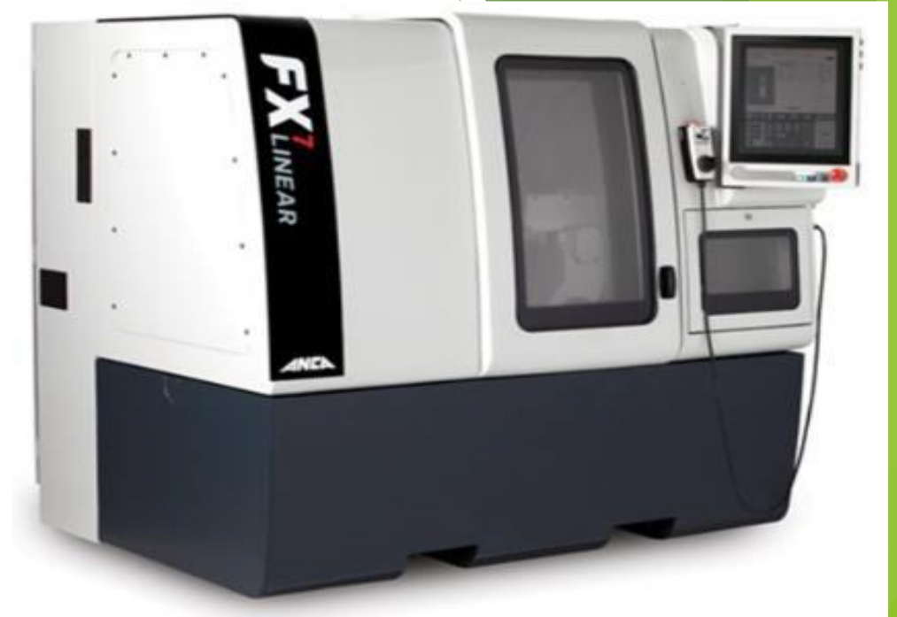
ANCA FX7 2019