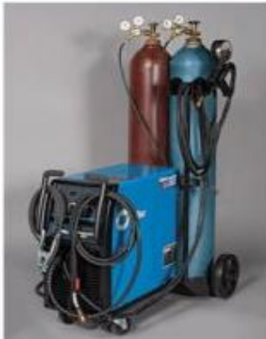
Soldadura de arco, TIG y MIG