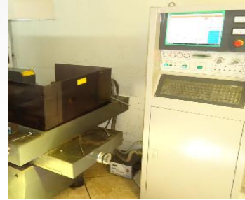
Corte con hilo