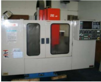
Centro de maquinado (CNC)