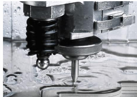
Corte con chorro de agua