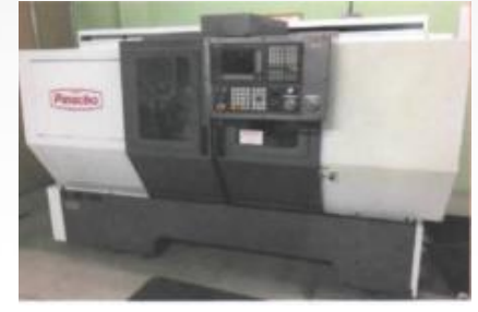
Torno de control numérico